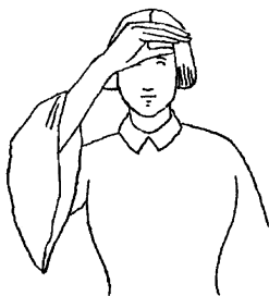
Fig. 5. HOMME Brouland 1855