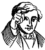
Fig. 4. HOMME Pélissier 1856

Cette hypothèse se trouve confirmée par la présence de ce signe à Paris même au XIX e siècle, lorsqu'une seconde étape de la recherche conduit à explorer les sources anciennes : avec le sens de « homme », il figure dans le recueil de signes publié par Pierre Pélissier (1856), professeur sourd-muet à l'institut de la rue Saint-Jacques (fig. 4). Commenté « signe de tirer le chapeau », il entrait alors en concurrence avec deux autres signes HOMME qui, également placés au niveau de la tête, en différaient par la configuration. L'un, avec la main en faisceau (fig. 5), est commenté « faire l'action de prendre son chapeau pour saluer » par Joséphine Brouland (1855). L'autre, avec la main en clé (fig. 6), est commenté « signe de lever et remettre le chapeau sur sa tête » par l'abbé Lambert (1865).