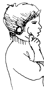
Fig. 1. SEX. Tennant et Gluzak Brown 2002

s'étendent au domaine de la sexualité. L'index en crochet touche le haut puis le bas de la joue (fig. 1). Présent dans plusieurs recueils contemporains (Costello 1994, Sternberg 1994, Tennant et Gluzak Brown 2002), ce signe est absent de tous les recueils anciens (Brown 1856, Long 1918, Higgins 1923, Michaels 1923). De même qu'en France avant les années 1980, ces recueils sont toujours limités à quelques centaines de signes parmi les plus courants. Cela suffit à expliquer cette absence, bien que l'on puisse également soupçonner que le signe a été écarté en raison de ses liens avec la sexualité.