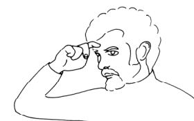
Fig. 2. GARÇON à St-Laurent-en-Royans