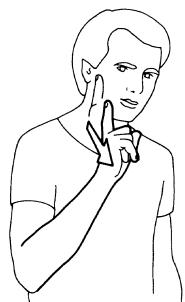
Fig. 7. FEMME Ivt 1986

Si la configuration en crochet a été introduite par l'abbé de l'Épée pour les motifs que l'on vient de voir, les emplacements empruntent certainement aux signes spontanés HOMME et FEMME qu'il pouvait observer chez les sourds venant à ses leçons. Pour ce qui est du signe HOMME, nous disposons du témoignage de l'abbé Ferrand (vers 1785), contemporain de l'abbé de l'Épée : « porter la main au chapeau ». Du signe FEMME, nous ne disposons que de témoignages postérieurs à l'abbé de l'Épée : l'index ou le pouce glissent le long de la joue pour styliser « la garniture du bonnet » (Puybonnieux 1846) ou « le ruban de la coiffe » (Lambert 1865). Ce signe s'est maintenu inchangé jusqu'aujourd'hui (fig. 7).