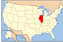
Illinois Estados Unidos

Marlee Beth Matlin nació el 24 de agosto de 1965 en Morton Grove, Illinois, uno de los cincuenta estados que conforman los Estados Unidos.