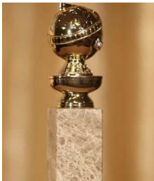
Premios Globo de Oro

Con este film, que fue su debut cinematográfico, ganó en 1987 un Globo de Oro a la mejor actriz dramática y otro premio que significa el reconocimiento a la excelencia en logros cinematográficos, conocido como Oscar, que en su caso fue a la mejor actriz, otorgado por la Academia de las Artes y las Ciencias Cinematográficas en Los Ángeles, California.